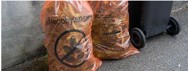
(Bildlegende:) Neophytensäcke können am Schalter der Gemeindeverwaltung abgeholt werden.

Das Ablagern von Gartenabfällen und Rasenschnitt im Wald und am Rand von Gewässern ist verboten! Danke, dass Sie mithelfen Problempflanzen zu bekämpfen.