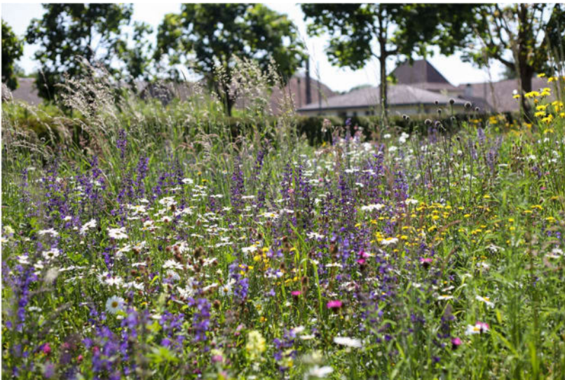
(Bildlegende:) Naturnahe Wiese anstelle von sterilem Rasen

Weiterführende Informationen: www.umweltberatung-luzern.ch/themen/naturgarten-lebensraeume/artenvielfalt-foerdern/blumenwiese-oder-rasen