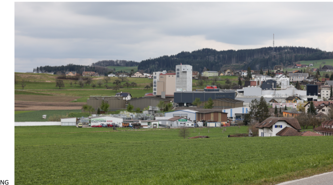
VISUALISIERUNG DIENT ZUR ANSICHT, ABWEICHUNGEN/ÄNDERUNGEN ZU PLANEN MÖGLICH