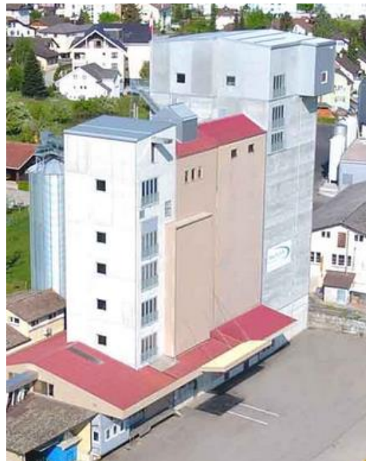
Betriebsansicht mit Rundsiloanlage, Getreidesilo 2016 (mit Fahne) und Maschinensilo 2019 (aufgestockt auf Lagerhalle)

Mit diesen Grossprojekten sind unsere Baulandreserven ausgeschöpft. Dabei haben wir auch die Platzreserven auf den bestehenden Bauten ausgenützt. So wurde für den Neubau des Maschinensilos 2019 beispielsweise die bestehende Lagerhalle aufgestockt.