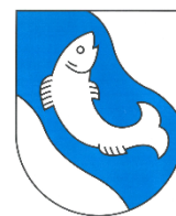
Rickenbach (Ortsteil Pfeffikon)