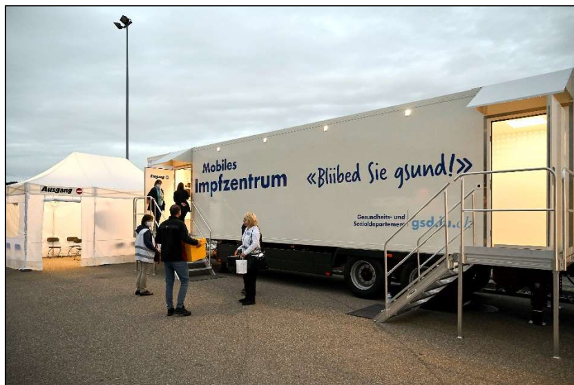
Auch auswärtige Impfwillige können sich am 15. Oktober und 12. November beim mobilen Impfzentrum gegen COVID-19 impfen lassen

Impfen lassen können sich alle Interessierten, auch Auswärtige, z.B. Personen, welche in Rickenbach arbeiten. Machen Sie von diesem unkomplizierten Angebot Gebrauch!